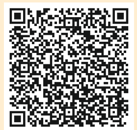
Interviews: sprachliche Bildung