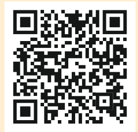
Campus Stiftung Lesen

Die Seite zeigt eindrucksvoll, warum Vorlesen eine echte Superkraft für Kinder ist. Sie erklärt, wie Vorlesen Sprache, Kreativität und Konzentration fördert und Kinder besser auf Schule und Alltag vorbereitet. Zudem stärkt es die Beziehung und macht Lust aufs eigene Lesenlernen. Die Stiftung Lesen motiviert zudem dazu, mehr vorzulesen und bietet wertvolle Tipps und Aktionen wie den Bundesweiten Vorlesetag. Ein lohnenswerter Besuch für alle, die Kindern beste Chancen eröffnen wollen.