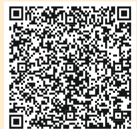
Podcastfolge: „Vorlesen ist eine Superkraft“