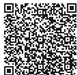
Interviews: sprachliche Bildung

Auf der Seite zum Bundesprogramm „Sprach-Kitas: Weil Sprache der Schlüssel zur Welt ist“ finden sich neben Informationen zum Programm auch spannende Interviews rund um das Thema sprachliche Bildung. Expert*innen aus Pädagogik, Kindheitsforschung und Medizin geben darin Einblicke in ihre Arbeit und erläutern, wie Sprachförderung in den ersten Lebensjahren gelingt. Themen wie inklusive Pädagogik, Geschlechterunterschiede beim Spracherwerb, die Rolle der Familie oder die Frage, wie sich Sprache schon im Alltag ganz selbstverständlich fördern lässt, werden praxisnah beleuchtet. Die Interviews bieten wertvolle Impulse für Fachkräfte, Eltern und alle, die Kinder in ihrer Sprachentwicklung begleiten.