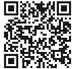
Campus Stiftung Lesen

Der Campus der Stiftung Lesen ist eine digitale Lernplattform rund um das Thema Leseförderung. Hier finden Interessierte eine übersichtliche Sammlung an Kursen, Materialien und Angeboten, die dabei unterstützen, Kinder und Jugendliche für das Lesen zu begeistern. Die Plattform richtet sich sowohl an pädagogische Fachkräfte als auch an ehrenamtlich Engagierte und bietet praxisnahe Inhalte, die flexibel online genutzt werden können. So dient der Campus als zentrale Anlaufstelle, um Lesekompetenz nachhaltig zu fördern und aktuelle Trends in der Lesedidaktik kennenzulernen.