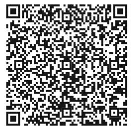
Podcastfolge: „Vorlesen ist eine Superkraft“